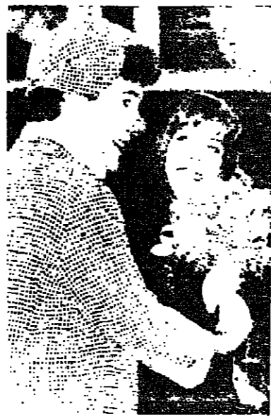
قبل بدء حفلة الافتتاح. مونت كارلو - أ ب وفي الصورة الثانية: مهرج يقدم إلى الأميرة كارولين باقة من الزهور لدى وصولها إلى مكان